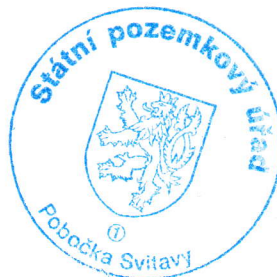
Ing. Miloš Šimek vedoucí Pobočky Svitavy Státní pozemkový úřad

rozšíření obvodu komplexních pozemkových úprav v katastrálním území Moravská Třebová (dále jen „KoPÚ“), které byly zahájeny dle ust. § 6 zákona dne 17.4.2014, o navazující část sousedícího katastrálního území Kunčina . Rozšířením obvodu KoPÚ jsou dotčeny tyto pozemky v katastrálním území Kunčina: KN 4165, KN 4166, KN 5197, KN 5198, KN 5199, KN 5200, KN 5201 a KN 5202 ).