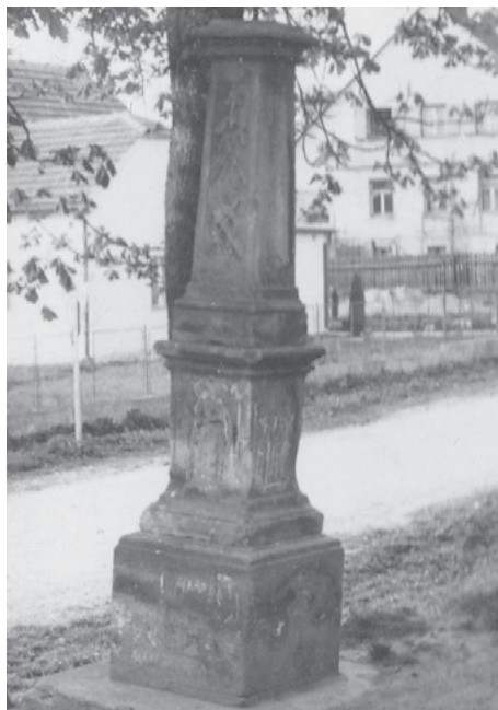
Architektura s křížem PŘED

Před zahájením restaurování bylo celé dílo deponováno v depozitu obce Kunčina. V průběhu restaurování bylo celé dílo převezeno na restaurátorské pracoviště, kde bylo podrobena komplexnímu restaurátorskému zákroku. Restaurátorský zákrok v restaurátorských etapách. Po