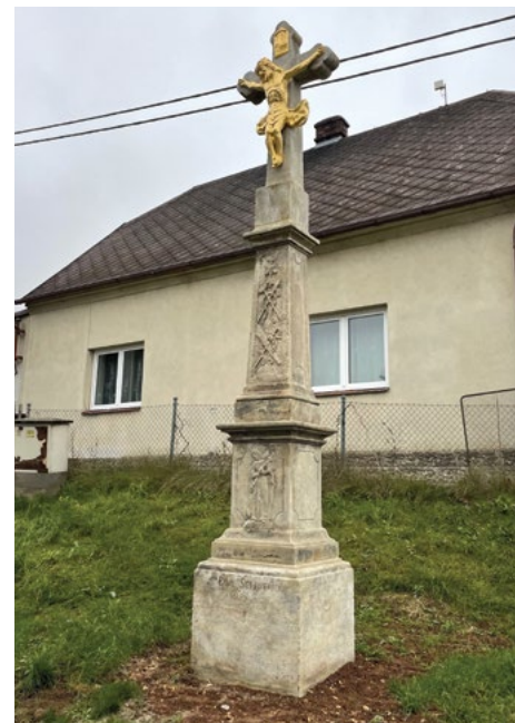
Architektura s křížem PO

ZDROJ: Restaurátorská zpráva, autorem MgA. Ondřej Sklenář, ArteGram s.r.o.