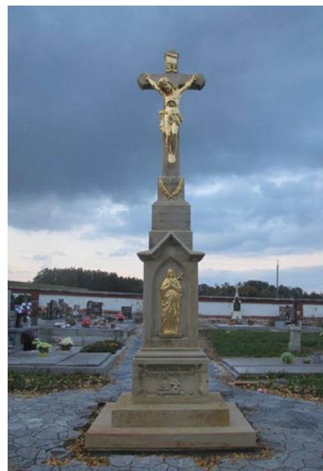
Centrální kříž hřbitov PO