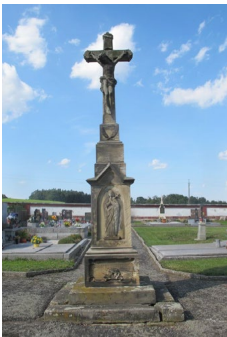
Centrální kříž hřbitov PŘED

ZDROJ: Restaurátorská zpráva, autorem MgA. Ondřej Sklenář, ArteGram s.r.o.