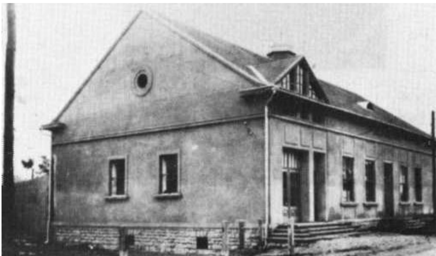
Spolkový dům v Kunčíně