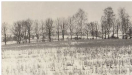
Šírův úvoz v roce 1973, určen k zavážení, celkový pohled od Sušic.

Kříž v polích za čp. 124, který stál blízko Liščí stezky. Původně ke kříži vedla cesta – Šírův úvoz, protože byly cesty rozorány, stojí dnes v poli. (viz. Berka, J. Kříže a církevní památky, Zpravodaj II/2004).