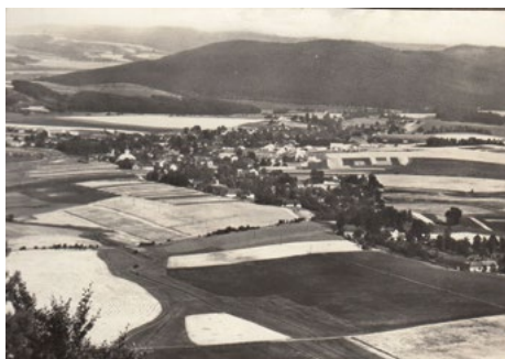
Letecký snímek z katastru Kunčiny.

Kunčina je položena v severní části Moravskotřebovské kotliny. Na severu u Kunčiny má Moravskotřebovská kotlina největší šířku přibližně 6,5 km. (Moravskotřebovsko, Svitavsko, Vlastivěda moravská). O přírodním prostředí Kunčiny (viz Životní prostředí Kunčiny, Zpravodaj I/ 2002)