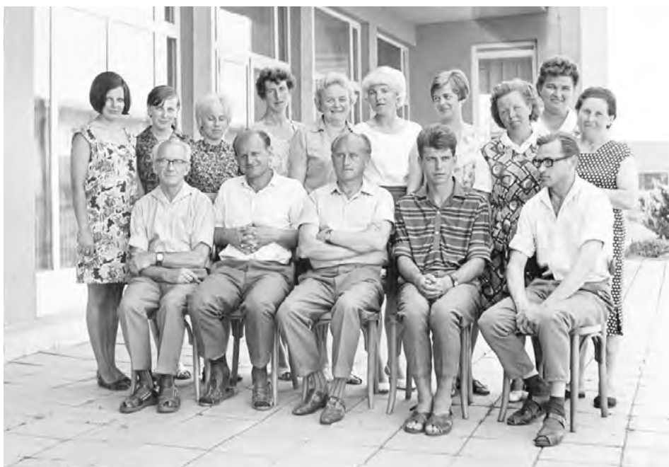
Učitelství 1967–1968