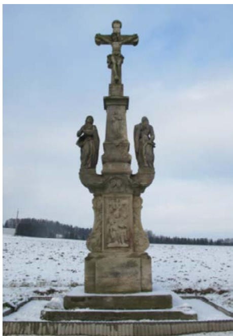
Stav před zahájením restaurátorských prací

voluty. Na římsce jsou vyobrazeny dvě hlavičky andělků. Na římsce nasedají z každé strany středověkého podstavce kříže sokly sochy Panny Marie a sv. Jana Evangelisty.