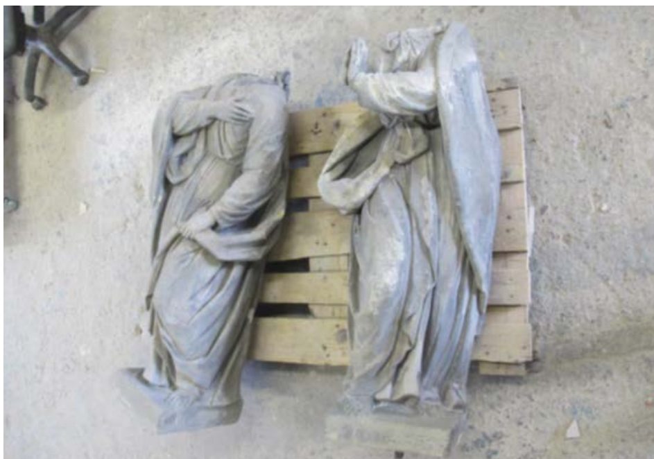
Stav před restaurováním, hlavy soch vykazovaly závažné trhliny, držel je pouze zkorodovaný čep