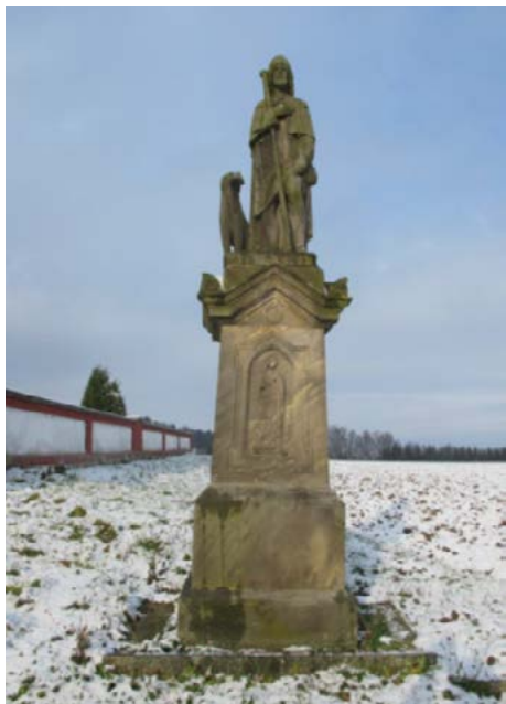
Socha sv. Rocha před zahájením restaurátorských prací

ZDROJ: Restaurátorská zpráva, autorem MgA. Ondřej Sklenář, ArteGram s.r.o.