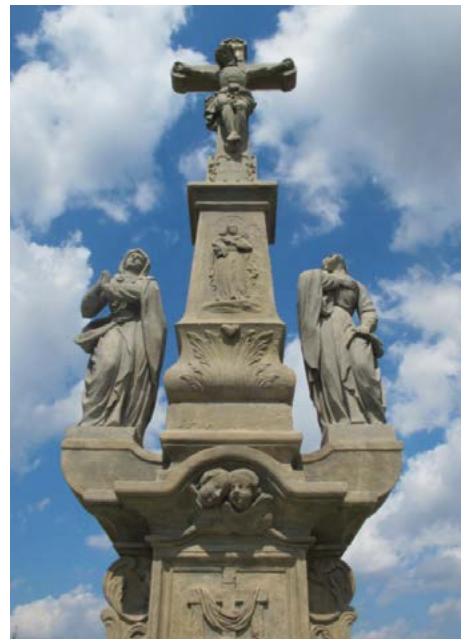
Stav po restaurování