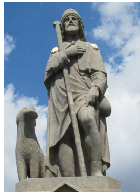
Socha sv. Rocha po dokončení restaurátorských prací