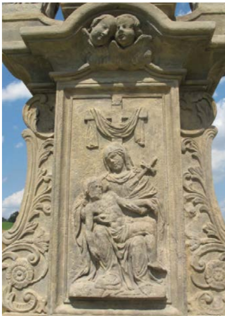
Stav po restaurování