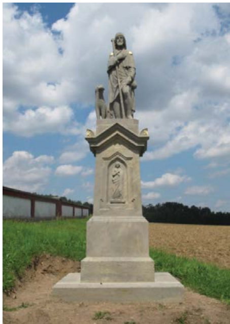
Socha sv. Rocha po dokončení restaurátorských prací