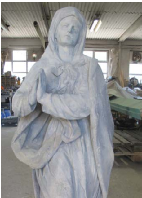
Tmelení a průběh retuší, hlavy jsou zčepovány nerezovými čepy a trhliny injektovány

ZDROJ: Restaurátorská zpráva, autorem MgA. Ondřej Sklenář, ArteGram s.r.o.