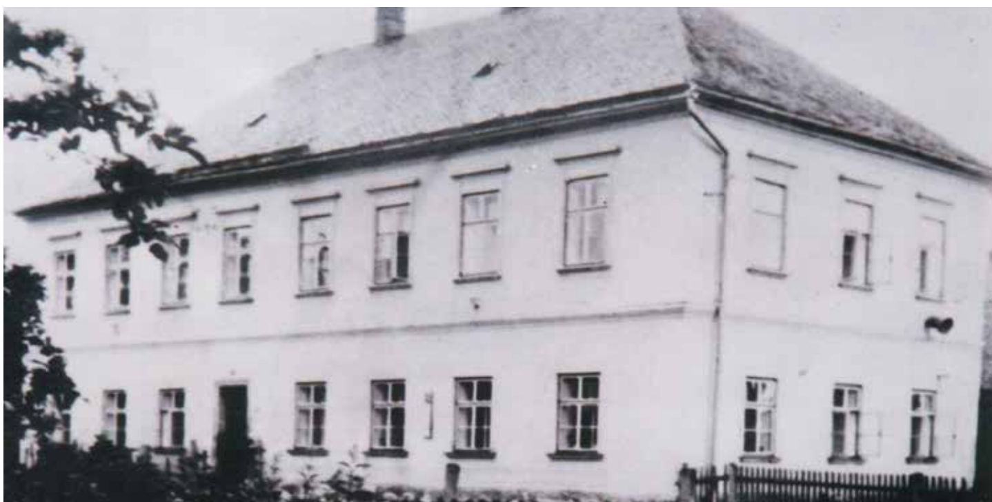
Ilustrace 3: Budova bývalé školy v Kunčíně sloužila k tomuto účelu do roku 1960. Dnes se tady nachází Mateřská škola.