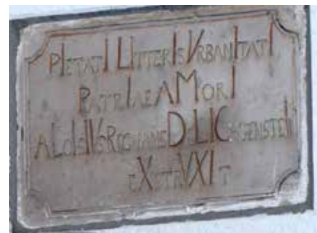
Ilustrace 2: Deska s latinským nápisem nad severní částí budovy mateřské školy.