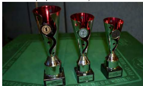
Poháry pro ty nejlepší byly opravdu důvodem zabojovat a prosadit se ve velké konkurenci.