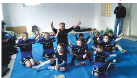
4. místo v Městečku Trnávce (8 mužstev)