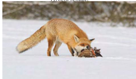
V roce 2014 bylo uloveno šest lišek. Lišky velmi škodí v revíru zejména na mláďatech zajíců a drobné zvěře.