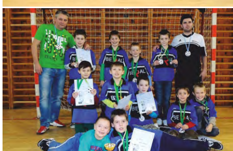
3. místo v Moravské Třebové (7 mužstev)