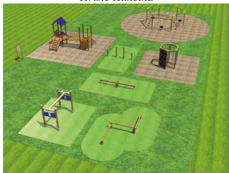
Hřiště Nová Ves