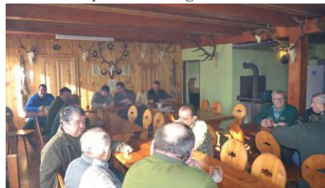
Klubovna Mysliveckého sdružení před zahájením výroční schůze.