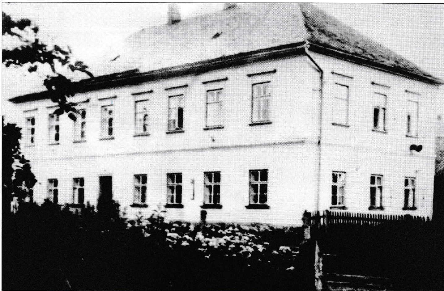
Původní budova školy z roku 1798.

Ve školním roce 1968/1969 začala rozsáhlá generální oprava budovy a mateřská škola se přestěhovala do náhradních prostor (opět dům čp. 90). Ve školním roce 1970/1971 se děti vrátily do nově opravené budovy, kde již byla zprovozněna i kuchyň pro MŠ a paní Selingerová zde začala vařit jako kuchařka. Dříve obědy zajišťovali v ZDŠ.