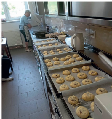
Výbor Klubu důchodců

Přejeme všem pěkně prožitý podzimních dnů se sluníčkem ve zdraví a pohodě.