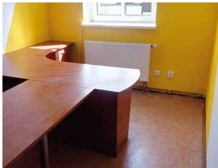
Kancelář referentky OÚ před malováním