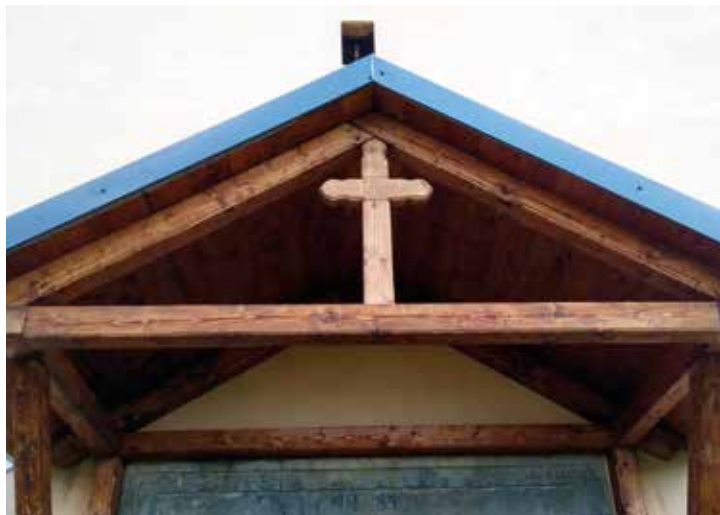
Nový přístřešek s dominantním křížem nad hlavním vchodem do kaple