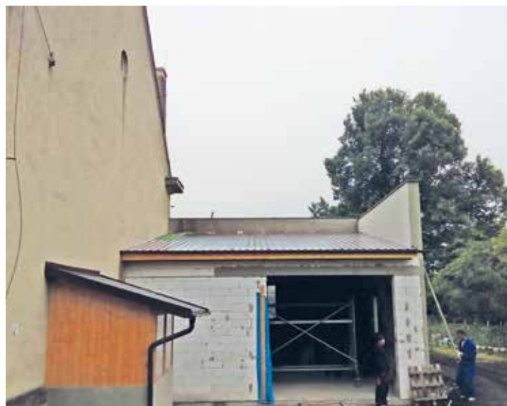
Dostavba skladu pro komunální techniku u KD Kunčina