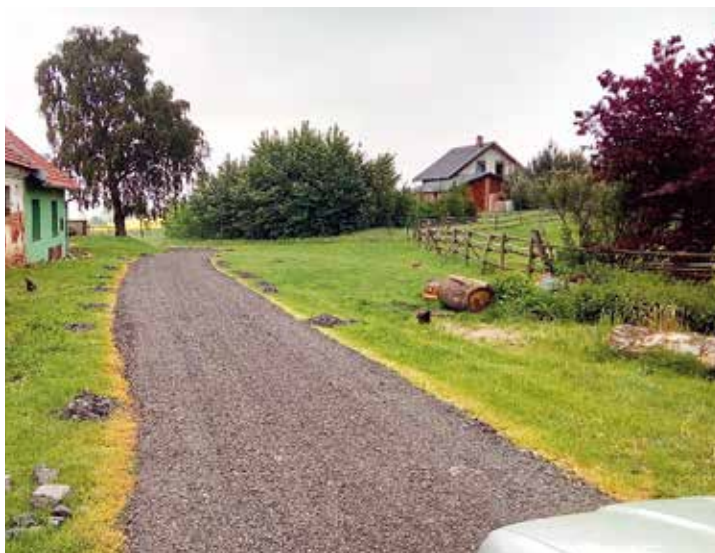
Úsek u myslivny v Nové Vsi