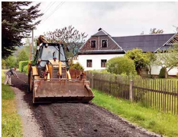
Nová Ves - úsek od KD ke Dvořákovým