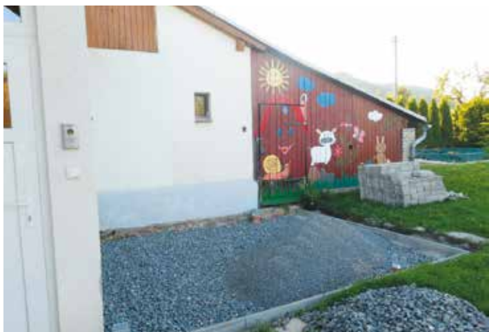
Za MŠ Hana Fafílková

O dění v MŠ Vás budeme pravidelně informovat prostřednictvím tohoto zpravodaje i na našich webových stránkách http://www.mskuncina.cz/ .