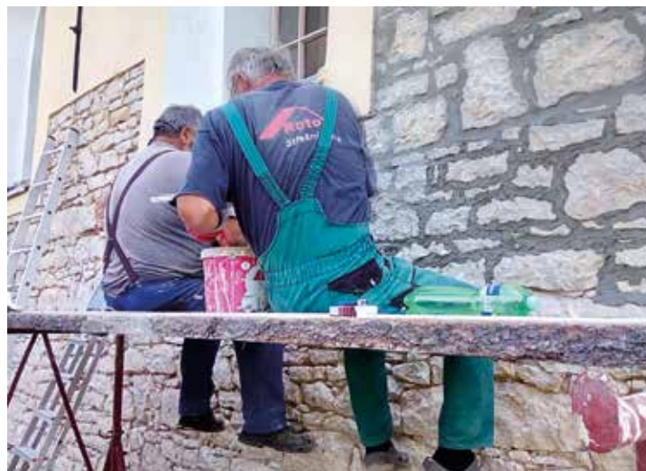
Nová omítka v severní části objektu