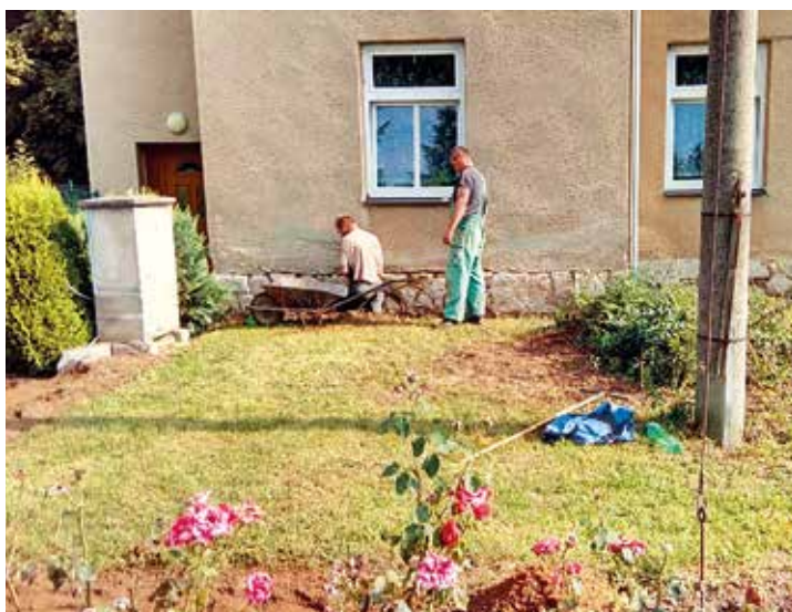
Odkopání jižní části budovy