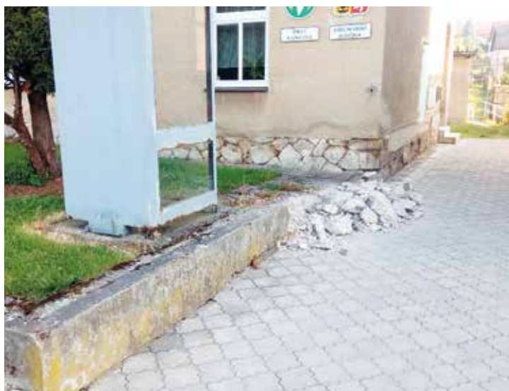
Odstranění poškozeného plotu a podezdívky