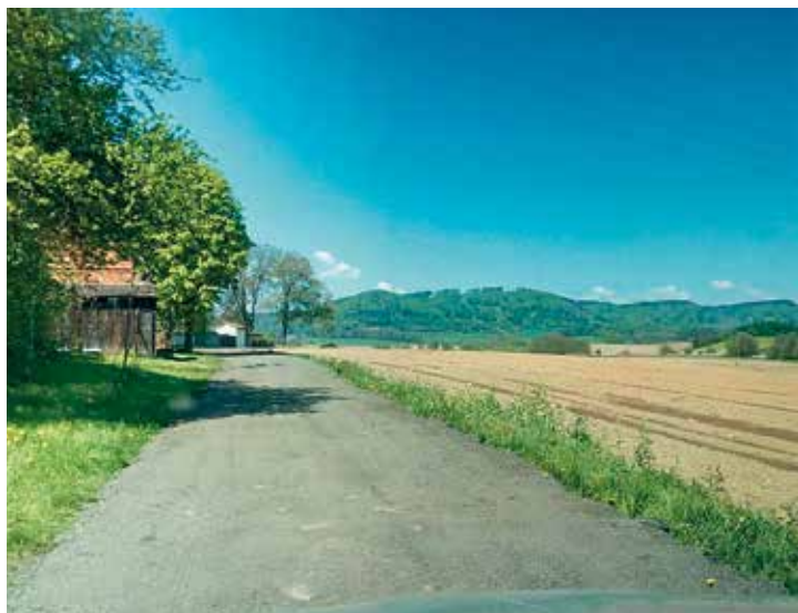
Úsek obecní cesty od hřbitova v Kunčíně směřující ke kompostárně