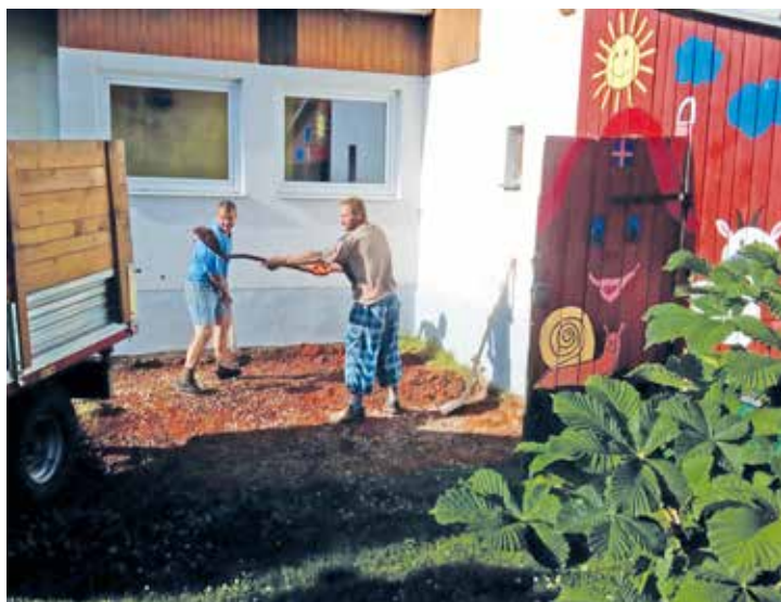
Vybudování přístřešku pro děti