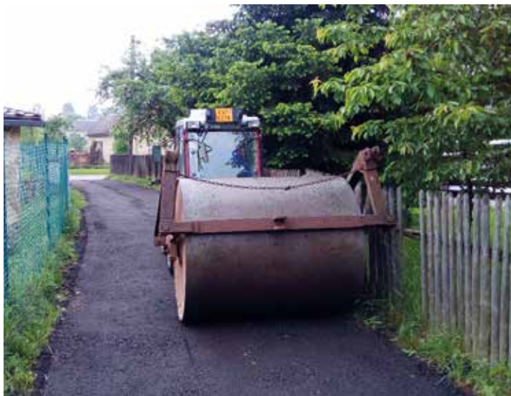
Ulička u pošty v Kunčíně