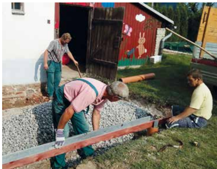
Pro děti bude vybudován prostor, který bude sloužit jako venkovní třída a jídelna